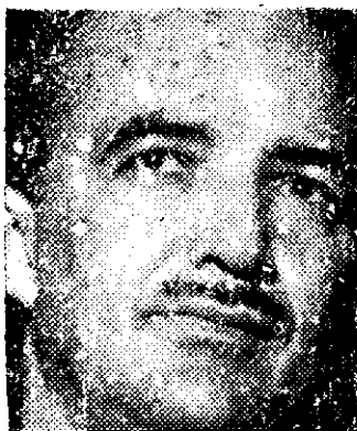
DR. JORGE ILLUECA (Información en la 8a. Pág.)

Según informes de fuentes bien informadas la ignominia de este nombramiento viene no sólo del hecho de nombrar a un extranjero para que lleve la representación panameña en un organismo internacional de tanta importancia como el Consejo de Administración de la FAO sino también porque el agraciado fue representante de Colombia durante la dictadura de Rojas Pinilla y destituido por negociar su voto.